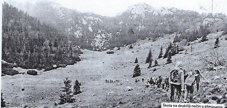
Škola na drukčiji način u planinama

„Uspjeh nije konačan, neuspjeh nije fatalan: ono što se računa jest hrabrost da se dalje nastavi.“ (Winston Churchill)